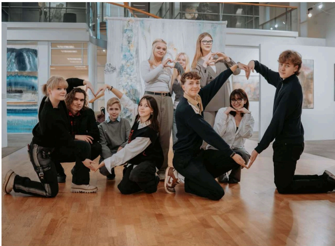
Pärnu linna Noortevolikogu!